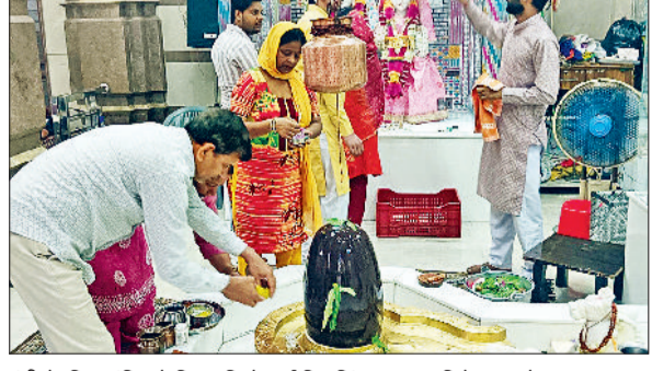
इंद्री के शिव मंदिर में शिवरात्रि के पर्व शिवलिंग पर जलामिषेक करते श्रद्धालु।

शिवरात्रि के पवन पर्व पर श्रद्धालुओं ने शिवलिंग का गंगाजल से जलामिषेक कर दूध, दही, शक्कर, शहद, घी व गन्ने का रस अर्पित किया और सुख शांति की कामना की। वहीं शिवरात्रि पर शिव भक्तों ने व्रत भी रखा। शिवरात्रि के पर्व पर मंदिर सुभार सभा इंद्री की ओर से डाक कावड़ लेने गए 50 कांवड़ियों ने शिव मंदिर इंद्री में शिवलिंग का