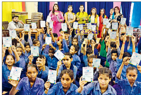
पानीपत। राजकीय स्कूल के विद्यार्थी स्वास्थ्य प्रमाण पत्र दिखाते हुए।