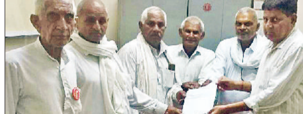
पानीपत। किसान सभा के पदाधिकारियों कृषि अधिकारी को मांग पत्र सौंपते हुए।