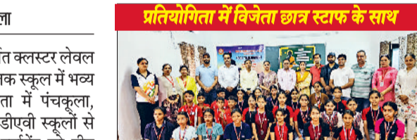
प्रतियोगिता में विजेता छात्र स्टाफ के साथ