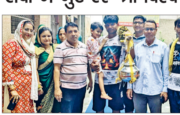
के रहने व खाने की व्यवस्था श्री विश्वकर्मा मंदिर द्वारा की गई थी।

श्री विश्वकर्मा मंदिर धर्मशाला रेलवे रोड गन्नौर मंडी में महाशिवरात्रि का त्योहार धूमधाम से मनाया। वहीं हर वर्ष की तरह इस वर्ष भी कांवड़ियों