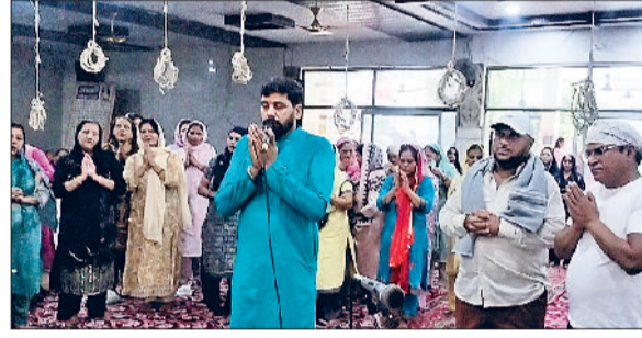
बराड़ा। मंदिर में पूजा-अर्चना करते हुए श्रद्धालु।

जाने वाले कांवड़ियों का मंगलवार सुबह से लेकर रात तक सिलसिला चलता रहा। इसके साथ कांवड़ शिविर में कांवड़ियों का दिनभर मेला लगा रहा। सुबह से ही कांवड़िए डाक कांवड़, बैठी कांवड़, झूला कांवड़, रथ कांवड़, बटरफ्लाई कांवड़, नंदी, शिव पार्वती कांवड़, लाइट वाली कांवड़ लेकर बाइक, ट्रैक्टर ट्राली, टाटा एस, ऑटो, साइकिल, जीप, पैदल व अन्य वाहनों में कांवड़ लेकर पहुंचे।