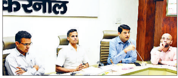
करनाल। सीईटी परीक्षा को लेकर बैठक में अफसरों को निर्देश देते डीसी।

करनाल के डीसी उत्तम सिंह ने हरियाणा कर्मचारी चयन आयोग द्वारा 26 व 27 जुलाई, 2025 को आयोजित होने वाली सामान्य पात्रता परीक्षा (सीईटी) को लेकर अधिकारियों को समीक्षा बैठक ली। उन्होंने परीक्षा केंद्रों की सुरक्षा, अभ्यर्थियों को परीक्षा केंद्रों तक लेकर आने और अन्य जिलों में भेजने को लेकर ट्रांसपोर्ट प्लान, पेपर को परीक्षा केंद्रों तक पहुंचाने का ट्रांसपोर्ट प्लान व परीक्षा केंद्रों पर मूलभूत सुविधाओं व अन्य तैयारियों को लेकर बैठक की। इस दौरान एडीसी सोनू भट्ट व हरियाणा कर्मचारी चयन आयोग के सदस्य कपिल अत्रेजा और एसपी गंगाराम