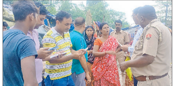
अंबाला। सर्व अभिधान के दौरान लोगों से पूछताछ करती पुलिस।