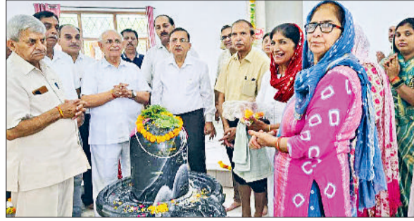
पानीपत। सोमनाथ धाम आश्रम गांव निंबरी में महाशिवरात्रि पर्व पर पूजन करते हुए श्रद्धालु व जीडी गोंयका स्कूल में महाशिवरात्रि पर्व पर पूजन करते हुए नन्हें मुन्ने श्रद्धालु।

पानीपत के शहरी व ग्रामीण अंचल में महाशिव रात्रि पर्व धूमधाम से मनाया गया। जहां शिवरात्रि पर्व पर हजारों डाक कांवड़ियों पानीपत से होते हुए अपनी मंजिल की ओर बढ़े। वहीं पानीपत के शहरी व ग्रामीण अंचल में लाखों कांवड़ियों ने श्रद्धालुओं के साथ भगवान शिव का गंगाजल से पूजन किया। पानीपत के प्राचीन देवी मंदिर, गांव भादड़ के शिव मंदिर समेत